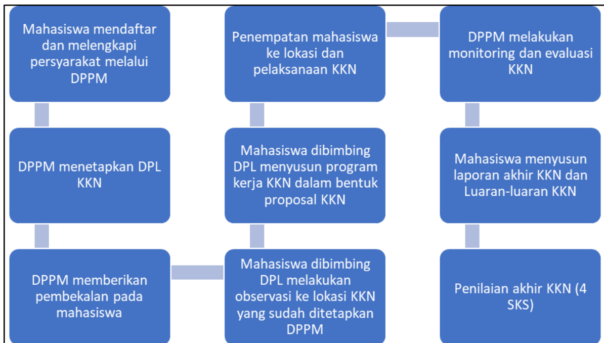
Gambar 2.1 Tahapan model KKN Reguler

Model KKN reguler merupakan KKN yang dilakukan dengan beban kredit 4 sks tanpa ada konversi mata kuliah. KKN dilakukan berdasarkan situasi dan kondisi desa, potensi dan permasalahan desa, serta Rencana Pembangunan Jangka Menengah Desa (RPJMDes). Desa yang menjadi lokasi KKN merupakan desa yang sudah ditetapkan oleh DP3PM. DP3M juga melakukan penetapan Dosen Pembimbing Lapangan (DPL) untuk membimbing mahasiswa selama melaksanakan KKN reguler. Pelaksanaan KKN dilaksanakan oleh mahasiswa dari berbagai disiplin ilmu atau multidisiplin. Mahasiswa yang dapat mengikuti KKN reguler merupakan mahasiswa yang sudah menempuh sebagian besar beban kredit perkuliahan minimal 110 sks. Tahapan model KKN reguler dijelaskan pada Gambar 2.1.